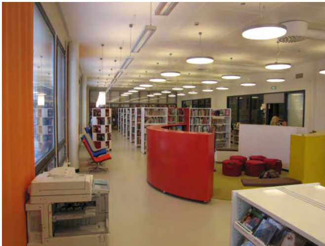
Ritaharjun kirjasto monitoimitalossa

Poikkihallinnollista toimintamallia ja monialaisia palvelurakenteita sovelletaan tulevaisuudessa kaupungin omissa palveluissa aina, kun palveluiden kysynnässä ja tarjonnassa on tarve tehdä olennaisia muutoksia.