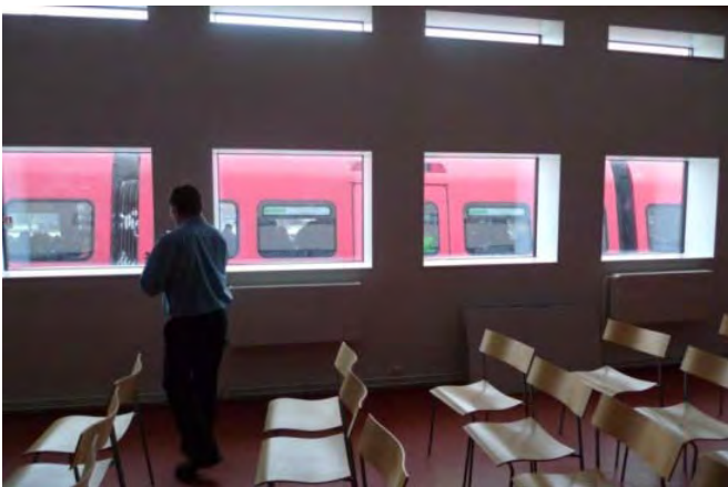
Metrolla suoraan kirjastoon, Tanska

Palveluiden tulee olla mahdollisimman joustavasti asukkaiden saavutettavissa sekä sijainnin että aukioloaikojen suhteen. Uusi Oulu tulee olemaan pinta-alaltaan suuri ja keskimääräiseltä väestötiheydeltään alhainen, mikä aiheuttaa haasteita palveluiden tasapuoliselle järjestämiselle. Alueelliset palvelut tuleekin sijoittaa hyvien joukkoliikenneyhteyksien läheisyyteen, jotta välimatkat eivät muodostu esteeksi palveluiden saavutettavuudelle. Samoin sijoittelussa on huomioitava ihmisten luonnolliset kulkureitit - eli alueen palvelut järjestetään sinne, missä ihmiset muutenkin liikkuvat. Tällainen kehitys on ekologisestikin perusteltua, jos näin voidaan vähentää turhaa liikennöintiä erillään sijaitsevien kauppakeskusten, kotien ja julkisten palveluiden välillä. Yhden luukun periaate parantaa asiakkaan näkökulmasta palveluiden saavutettavuutta. Työryhmä esittää, että joukkoliikenteen kehittämiseen kiinnitetään erityistä huomiota näistä lähtökohdista.