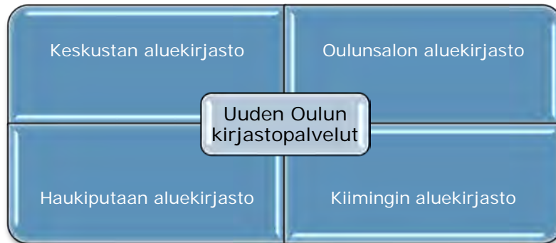
Uuden Oulun neljä aluekirjastoa

Työryhmä esittää, että uuden Oulun kirjastopalvelut tuotetaan aluekirjastomallilla. Palveluverkko koostuu neljästä aluekirjastosta, joiden alaisuudessa toimivat lähikirjastot. Aluekirjastoiksi on luontevaa nimetä nykyiset kaupungin- ja kunnankirjastot, koska niissä on jo lähtökohtaisesti soveltuvat tilat, tarvittava osaaminen ja muut resurssit. Aluekirjastot muodostetaan Oulun, Oulunsalon, Haukiputaan ja Kiimingin pääkirjastoista.