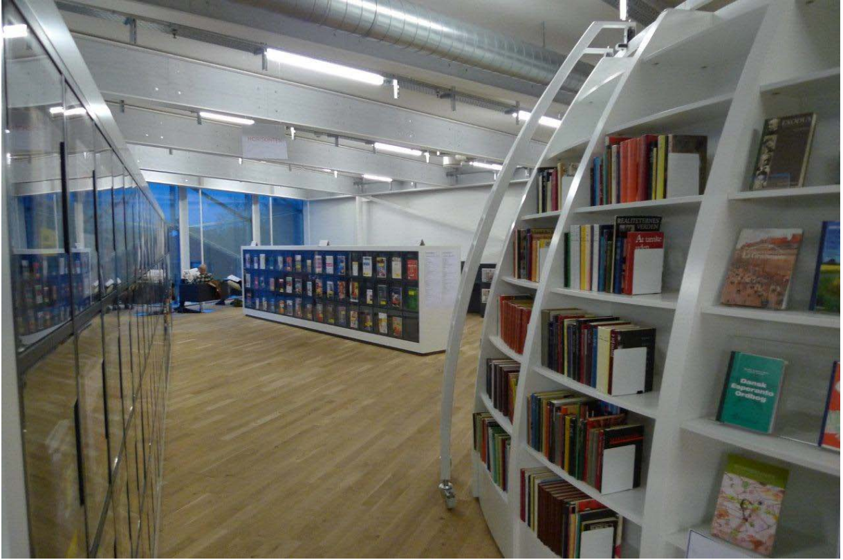
Kuvat Ilkka Jaakola: työryhmän Tanskan opintomatkalta