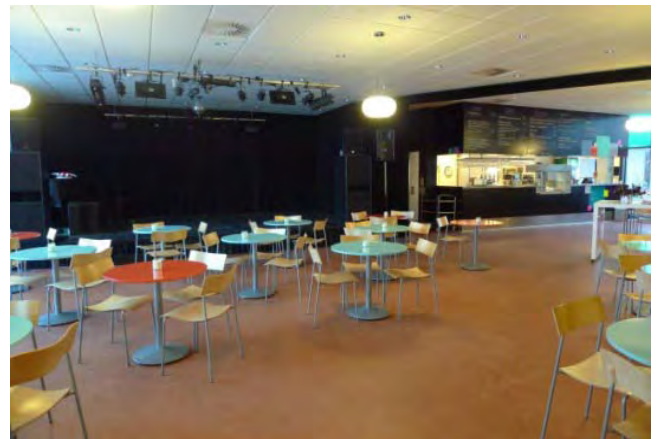
Monikäyttöinen, muunneltava tila, Tanska